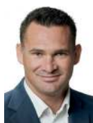
Marcel Dobler Conseiller national PLR Entrepreneur, SG

« Notre prévoyance vieillesse n'est pas garantie à long terme. Dans un contexte toujours plus difficile pour les salariés et les employeurs, il faut renoncer à créer une charge supplémentaire sous la forme d'un congé de paternité. »