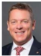
Casimir Platzer Président GastroSuisse

« Un congé de paternité imposé par la loi n'est pas supportable financièrement face à la crise économique provoquée par la pandémie Covid-19 et face à l'explosion des charges sociales. »