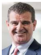
Peter Spuhler anc. conseiller national UDC Chef d'entreprise

« Un congé de paternité imposé par la loi n'est pas supportable financièrement face à la crise économique provoquée par la pandémie Covid-19 et face à l'explosion des charges sociales. »